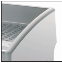
White / Λευκό / Бял