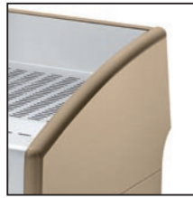
Sand / Της άμμου / Пясъчен