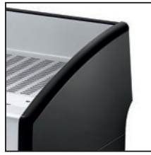
Black / Μαύρο / Черен